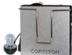
ポケット型補聴器 コルチトン補聴器カタログより

両耳とも90dBより聞こえがいい障害者(6級、4級)を対象とした補聴器で、マイクロホンが組み込まれた箱形の本体をポケット等に入れて、コード付きのイヤホンで聴くポケット型と、耳介の後ろに掛けて使用する耳掛け型があります。