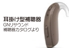
耳掛け型補聴器

両耳とも90dBより聞こえが悪い障害者(3級、2級)を対象とした補聴器で、ポケット型と耳掛け型があります。